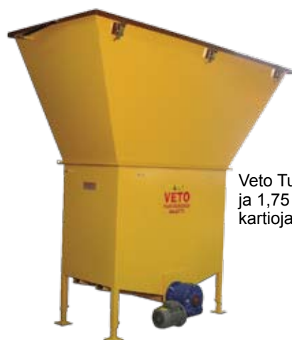
Veto Turvehakemaatti ja 1,75 m 3 kartiojatkosiilo