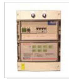
A-T Log 1 on logiikkapohjainen ohjauskeskus

Veljekset Ala-Talkkari Oy:llä on yli 50 vuoden kokemus kotimaisen polttoaineen lämmityslaitteiden valmistuksesta. Tehdas on ollut alusta asti mukana valtakunnallisessa kotimaisen energian kehitystyössä. Veto Turvehakemaatti on tulosta tästä projektista, joka on keskittynyt helppokäyttöisten laitteiden valmistukseen. Polttolaitte (stokeri) on öljypoltin tapaa kattilan kylkeen kiinnitettävä laite joka toimii kattilan lämpötilan mukaan aivan kuten öljypoltin, mutta käyttää useita kiinteitä polttoaineita kuten haketta, turvetta, pellettiä, brikettiä tai energiaviljaa. Laitteet on testattu EN-303-5 mukaan (VTT, Vakola, BLT Wieselburg, SP, Teknologisk Institut). Toimitukseen sisältyy logiikka-pohjainen ohjauskeskus, kattilatermostaatti, vesipalosalukku, liekinvalvonta, syöttöputken ylikuumentermestaatti sekä päävirtakytkin.